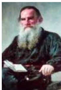
Лев Николаевич Толстой

Соедини линиями портреты великих педагогов с их высказываниями.