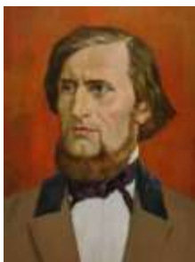
Константин Дмитриевич Ушинский