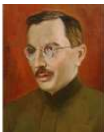
Антон Семёнович Макаренко

«Вся гордость учителя в учениках, в росте посеянных им семян»