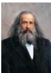
Дмитрий Иванович Менделеев